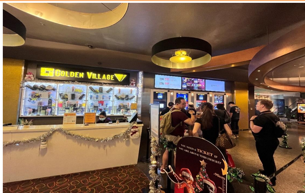
图 4: 新加坡影院现场 (12 月 18 日)

新加坡滨海湾金沙购物中心 GOLDEN VILLAGE (调研时间: 2022 年 12 月 17 日晚八点): 《阿凡达》上座率达到 90% 左右; 家庭占比超过 50%。没有强制口罩政策, 50% 观影者不戴口罩, 50% 戴普通口罩, 商场客流充裕。