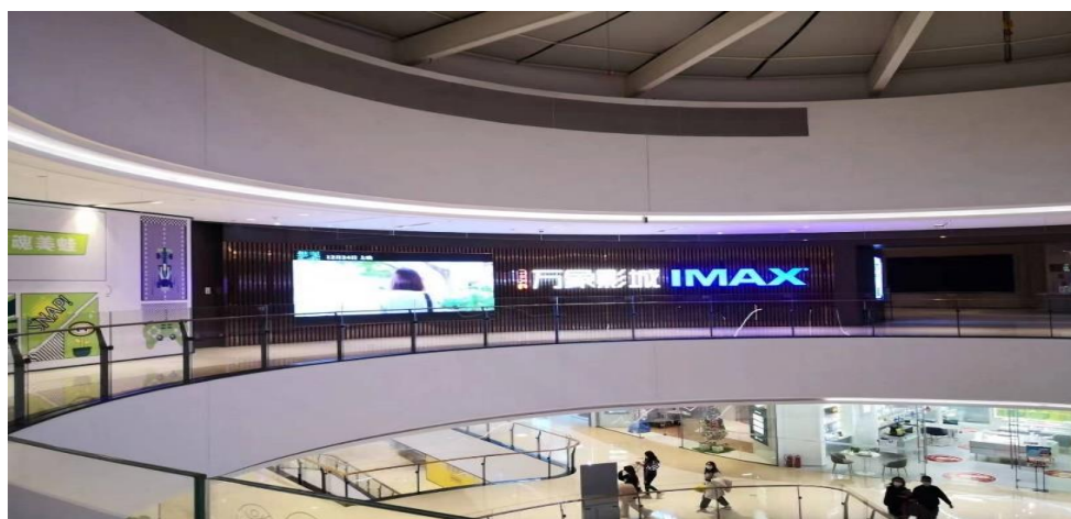
图 12：石家庄实地考察（12 月 25 日）