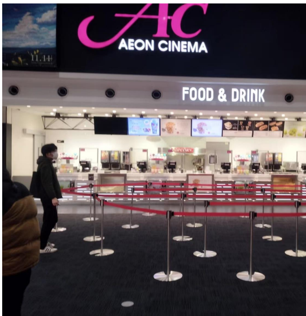
图 6：日本线下调研（12 月 19 日）

日本东京 AEON Cinema( 调研时间:2022 年 12 月 19 日晚八点 ):《阿凡达》上座率 10%，主要为年轻人。日本观影习惯是白天看电影，晚上票价便宜。店员反馈《阿凡达》白天上座率在 20%左右，周日不超过 50%。日本自疫情以来都要求所有公共场所佩戴口罩，民众对口罩的接受度较高都自觉佩戴。此外日本对动画电影如《灌篮高手》《航海王》等接受度较高，店员反馈几乎每一场动画电影上座率都超过 70%。