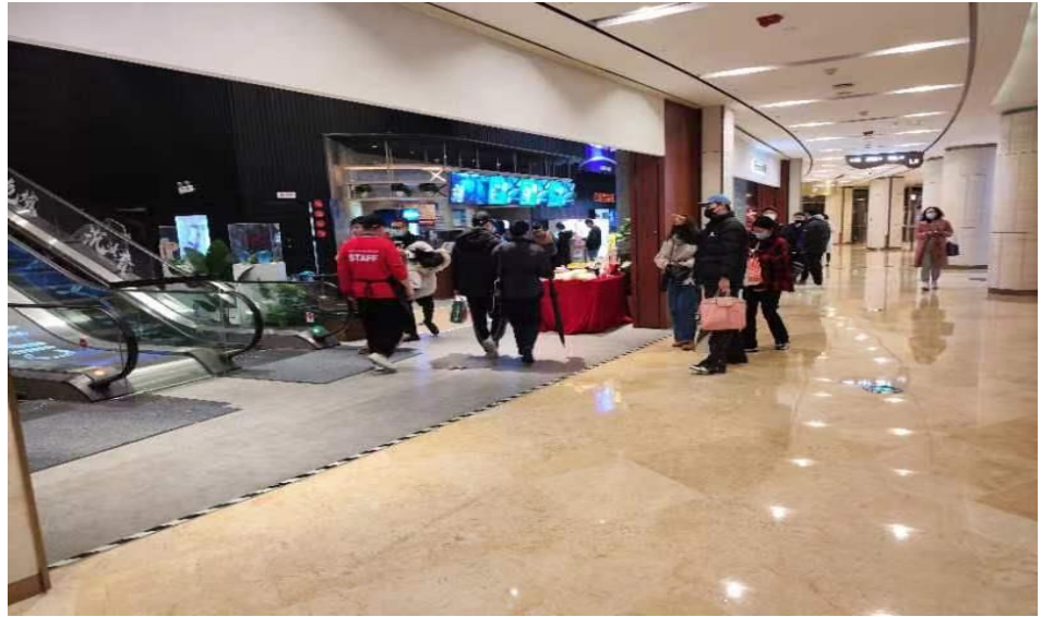
图 10：上海世纪汇实地考察（12 月 16 日）

上海（调研时间：2022 年 12 月 16 日晚八点世纪汇电影院）：《阿凡达》晚八点场到场约 120 人，十点场约 90 人，观影核心区域基本坐满。商场客流主要系观影人群，观众主要以年轻情侣为主。