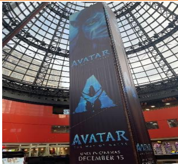
图 8：墨尔本影院现场（12 月 18 日）

澳大利亚墨尔本中央火车站 Hoytz 电影院（调研时间：2022 年 12 月 18 日晚八点）：《阿凡达》当天上座率超过 90%，店员反馈上映以来全天的场次基本满场，我们估计 18-40 岁大约占据了 70% 的人群。电影院没有强制口罩政策，整体戴口罩的比率不足 1%，戴口罩的人群主要为老年人。