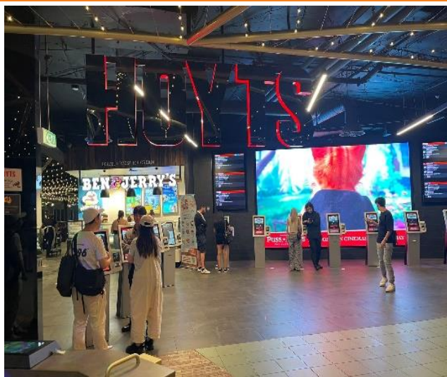
图 9：墨尔本影院现场（12 月 18 日）