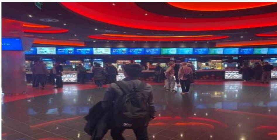
图 5：布达佩斯影院现场（12 月 18 日）