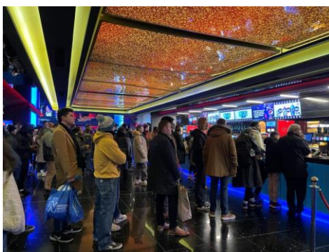
图 3: 伦敦 Leicester Square Cineworld 电影院 (12 月 18 日)

英国伦敦 Cineworld Leicester Square (调研时间: 2022 年 12 月 18 日晚八点): 目前已经取消强制口罩政策, 影院几乎无人戴口罩。《阿凡达》IMAX 场上座率接近 95%。观影人员年龄段以中年人为主, 其次是年轻人。