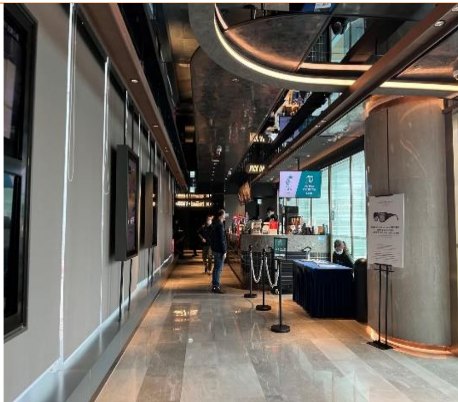
图 13：香港实地考察（12 月 18 日）

香港（调研时间：2022 年 12 月 18 日尖沙咀 iSQUARE 英皇戏院（IMAX with Laser 巨幕的 IMAX 影院））：《阿凡达》当天两场上座率高达 95%以上，我们估计观影人群年龄在 20-60 岁均匀分布。目前观影不再需要扫描行程码，但入场需出示疫苗接种针卡；可连坐数从 4 座放宽到 12 座，电影院内饮食限制政策已经取消。