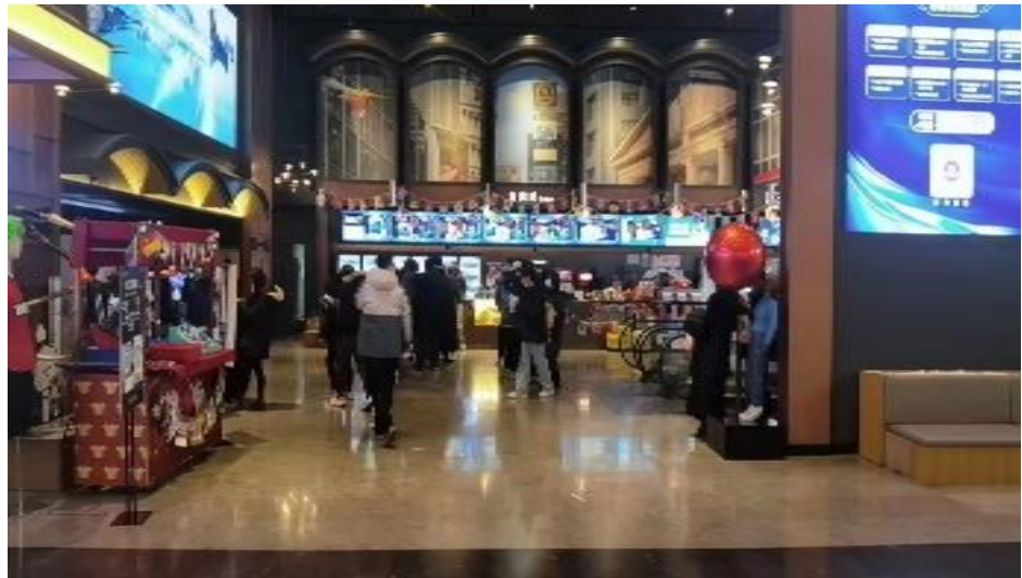
图 11：北京 CBD 实地考察（12 月 17 日）

北京（调研时间：2022 年 12 月 17 日晚八点 CBD 电影院）：晚上 6-9 点的黄金时间段《阿凡达》段上座率接近 90%，商场人流情况和上海类似，尽管人流较少但观影意愿仍较为强烈，十点后场次上座率下降明显，观影人群主要以年轻人为主。